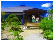
ののさま① ほっこり②