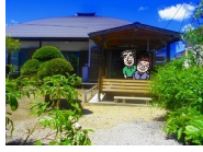
ののさま ほっこり